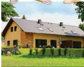
🏠 145 m 2 👤 6 🍳 3 🛏️ 2 AGA-SEEROMANTIK