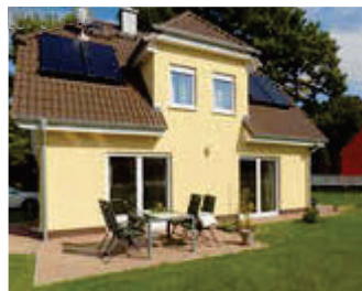
🏠 100 m 2 👤 4 🍳 2 🛏️ 2 SEESCHWALBE