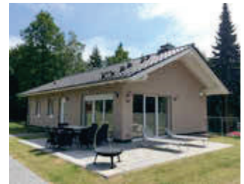
🏠 78 m 2 👤 4 🍳 2 🛏️ 2 KERSTIN