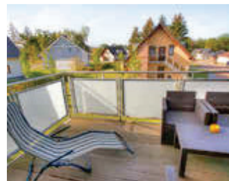
🏠 95 m 2 👤 4 🍳 2 🛏️ 1 OHANA DG