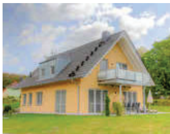
🏠 104 m 2 👤 4 🍳 2 🛏️ 1 OHANA EG