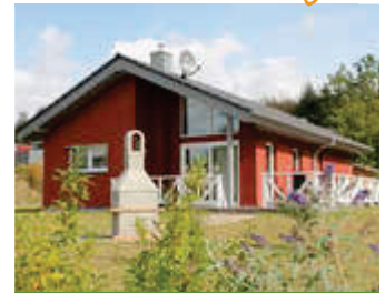
🏠 104 m 2 👤 6 🍳 3 🛏️ 2 TRINE