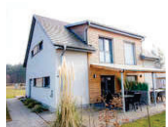
🏠 95 m 2 👤 6 🍳 3 🛏️ 2 ANITA