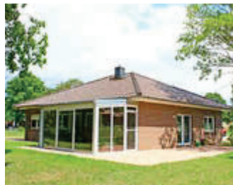
🏠 110 m 2 👤 4 🍳 2 🛏️ 1 DIANA