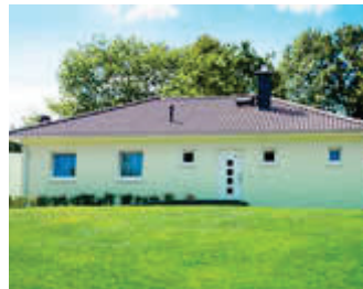
🏠 100 m 2 👤 6 🍳 3 🛏️ 1 SEEBLICK II