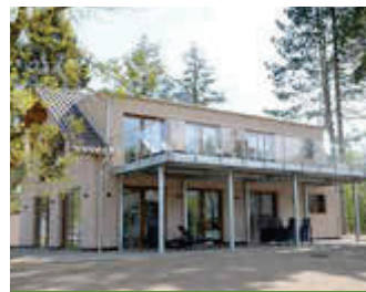
🏠 89 m 2 👤 2 🍳 1 🛏️ 1 EDITH PANORAMA