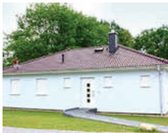
🏠 100 m 2 👤 6 🍳 3 🛏️ 1 SEEBLICK I