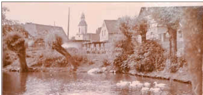
Ein typischer Dorfanblick mit Dorfteich (Rittergutsteich), Enten, Gänsen und Baumbewuchs. Die Kirche war der Dorfmittelpunkt.

Der Ort Kleinhelmsdorf, früher auch HELWIGSDORF, wurde im Jahre 1350 im Lehnbuch des Markgrafen Friedrich III (der Streng) festgeschrieben. Seitdem sind 674 Jahre vergangen. Kriege, Pest und Brände hat der Ort überstanden, die Bauern waren nicht frei, sie hatten Frondienste zu leisten, ein Zeugnis findet man heute noch in dem Torbogen eines Gehöftes.